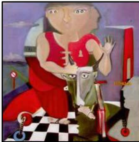
El Buey y Yo. (2006) 150x150cm. Óleo/Tela.

Sus obras reflejan como primera característica esa ruptura con la visión única renacentista: la ruptura de la perspectiva única (del modelo único).